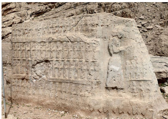
(نقاشی کول فرح).